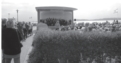
Zahlreiche Zuschauer ließen sich das 1. Muschelkonzert der Saison nicht entgehen