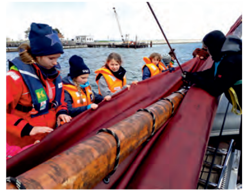
Nach jedem Segeltag werden die Segel verpackt

Bei der Einfahrt in den Hafen sitzen alle an Deck und singen das Lied von den „Männern mit Bärten“. Sie werden von Claudia mit der Gitarre begleitet, die auch das Lied vorher mit den Kindern einstudiert hat.