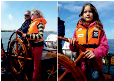
Skipper Dick bekommt Konkurrenz

Gleich nach dem Frühstück beginnt die Rückfahrt in die Heimat nach Laboe.