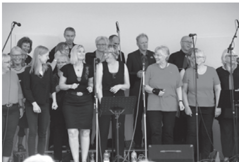
Die gut gelaunten Black Swans verbreiteten eine tolle Stimmung!