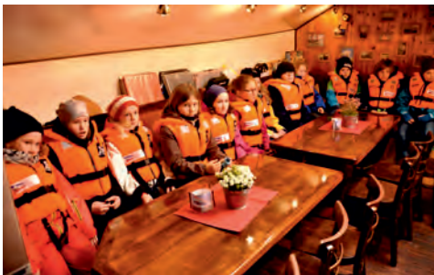
Sicherheitsunterweisung in der Messe und alle hören aufmerksam zu

Jeweils am letzten Tag werden die Sachen gepackt und die Kabinen besenrein verlassen. Hin und wieder gibt es kleine Reklamationen, die aber schnell von den „Verursachern“ erledigt werden.